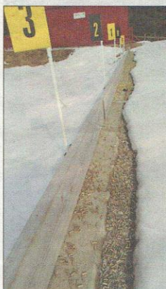
TOMHYLSER: Standplass med tomhylser etter vintersesongen hos MjøsSki.

Beslutningen er positiv fordi Fylkesmannen anser det sannsynlig at bruken av skytebanen vil forårsake blyforurensning av grunnvannet og vassdraget (Stokkerelva, Åstaddammen og Neselva).